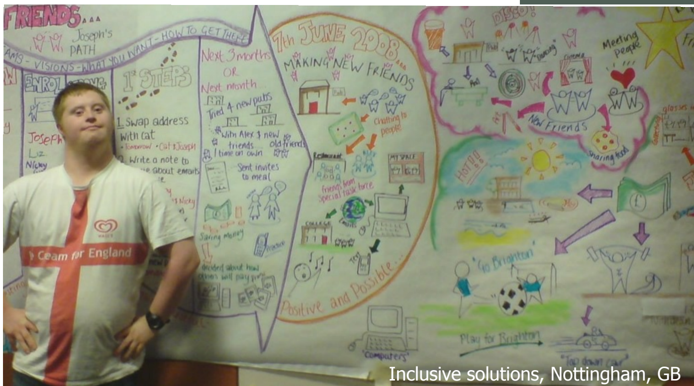
Inclusive solutions, Nottingham, GB

... zelf bepalen tot hoe laat je uit gaat 's nachts.