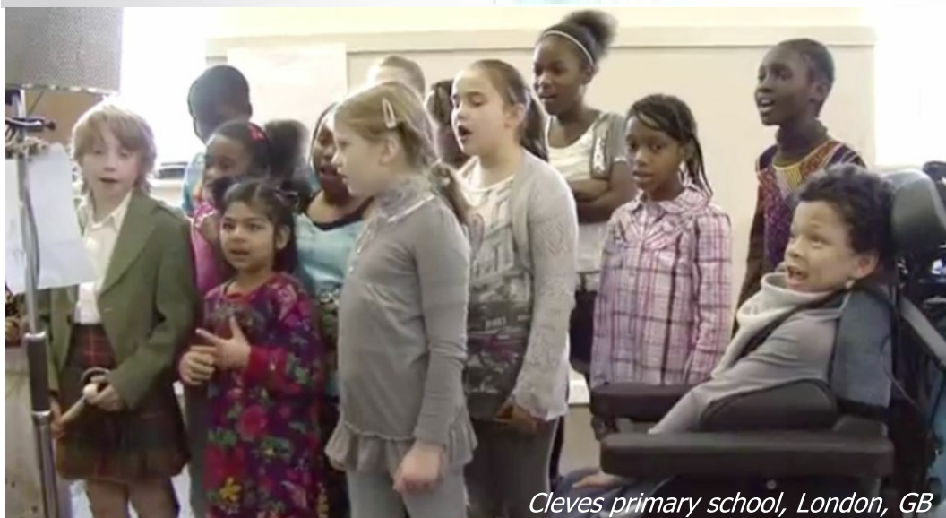
Cleves primary school, London, GB

Maak een lijst voor jezelf of voor iemand anders. Op welke punten kun jij zeggenschap vergroten? Verzin de eerste stap en onderneem actie.