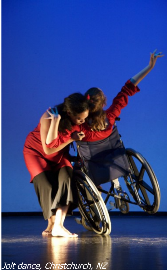
Jolt dance, Christchurch, NZ

Mensen geven elkaar doorlopend support bij de vormgeving van hun leven. Je helpt elkaar belangrijke beslissingen te nemen. Je introduceert iemand een keer bij een vriend of collega. Of je kookt iets extra's als een vriend of vriendin langer moet doorwerken. Mensen met een beperking hebben extra support nodig om gelijkwaardig mee te kunnen doen in de samenleving. Voor een deel gebeurt dat terloops, door bijvoorbeeld collega's op het werk, door familie thuis of door vrienden met wie je iets gaat drinken. Maar vaak heeft iemand ook professionele support nodig. Lees verder op pagina 16.